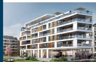
LE CIPRIANI/Rennes Grand Prix Régional Pyramide d'Argent 2017