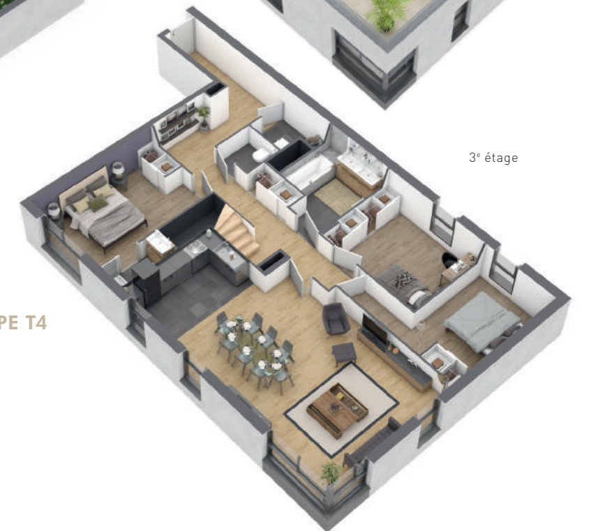
② APPARTEMENT TYPE T4 duplex d'environ 105 m 2 avec terrasse cuisine d'été