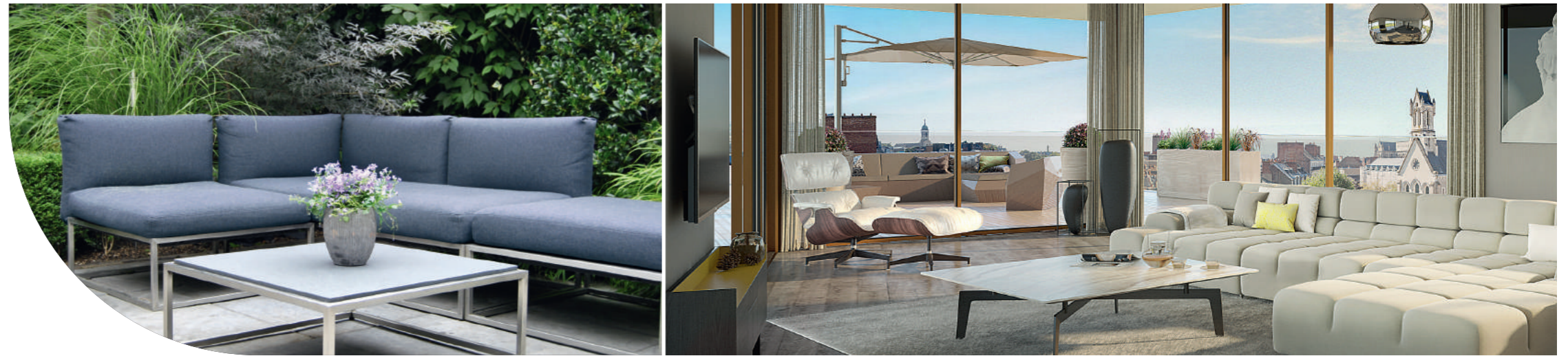
① GRAND APPARTEMENT T4 de 112 m 2 avec jardin privatif de 150 m 2

Plus haut, un second appartement type T4 duplex en R+3 offre le privilège d'une cuisine d'été encadrée de sa terrasse en rooftop. Pour accéder à ce lieu de rêve, vous empruntez l'escalier intérieur.