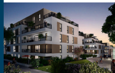
PASSAGE ST FÉLIX/Nantes