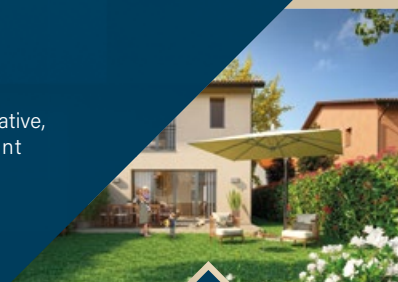
LES BASTIDES / Cessy

Recherche du terrain, sélection de l'architecte, choix des matériaux, l'expérience et les compétences des équipes sont tournées vers un seul but : satisfaire les acquéreurs et les investisseurs les plus exigeants.