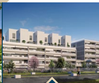
HORIZON / Sathonay-Camp